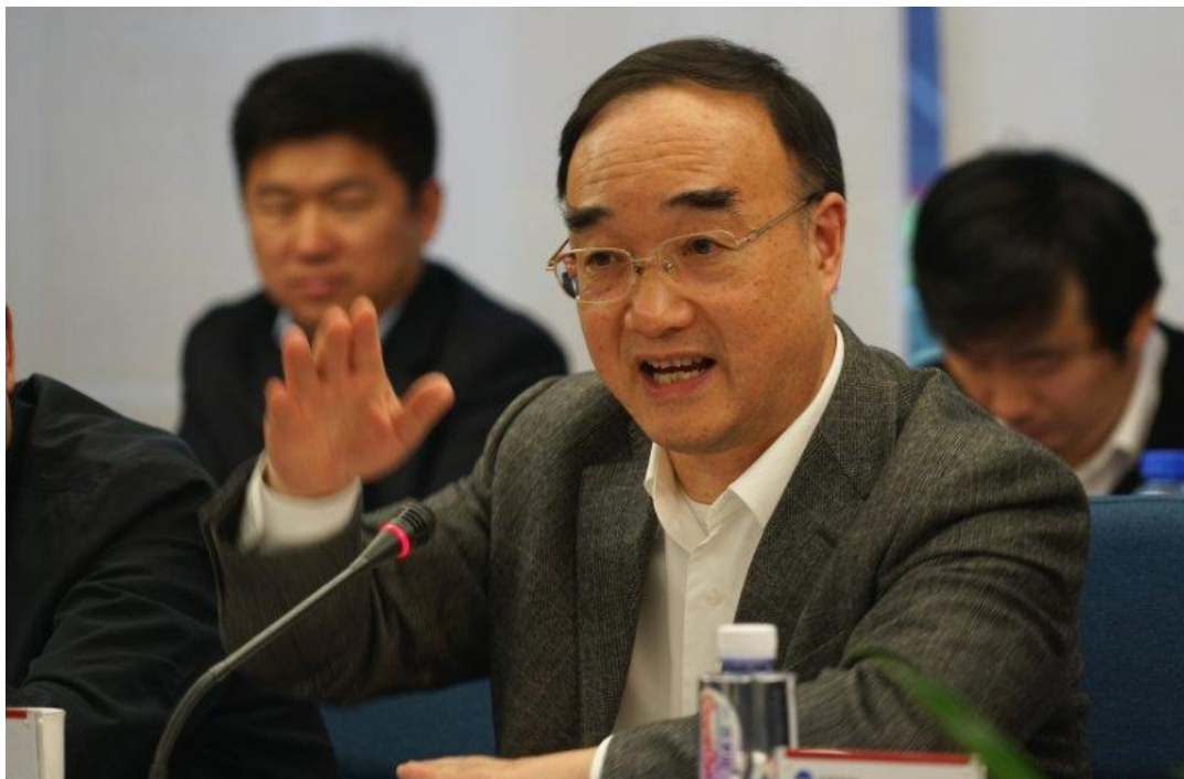
交通运输部原副部长、中国公路学会副理事长 翁孟勇

座谈过程中，专家们就课题推进过程中涉及到的政策、准入标准、技术、管理、设备、产业规划、人才培养、基础设施建设等内容进行了讨论和交流。专家组组长、交通部原副部长翁孟勇表示，推进“路空一体”化建设，既要有战略的眼光，也得有扎实的工作，要在国家顶层设计和政策环境下的指引下，推动形成可复制可推广的示范经验。“路空一体”战略已得到交通运输部领导的重视，技术条件成熟，地方发展意愿强烈，是一片充满希望的蓝海。翁副部长更提出“希望更多的像中信国际资产、中信海直这样的栋梁之才参与其中，抓住喀什地区‘路空一体’化建设的契机，面向未来提前谋划，发展前景将不可限量。”