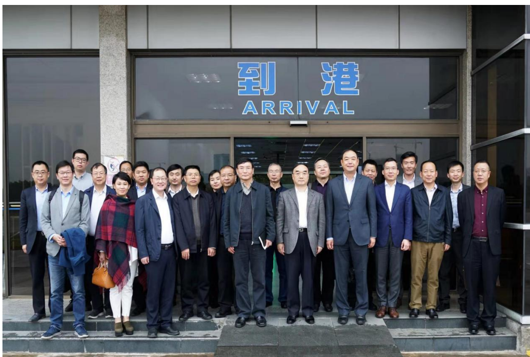
参与本次座谈会的调研组成员与中信集团成员